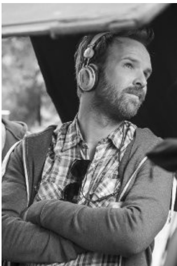
Stéphane Lafleur

Film canadien réalisé par Stéphane Lafleur avec Julianne Côté, Catherine Saint-Laurent, etc. Sortie nationale le 18 mars 2015 (1h 33mn)